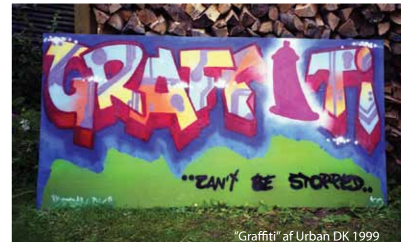
”Graffiti” af Urban DK 1999

I ovenstående artikel optræder Urban DK under kunstnernavn, redaktionen er bekendt med hans rigtige navn.